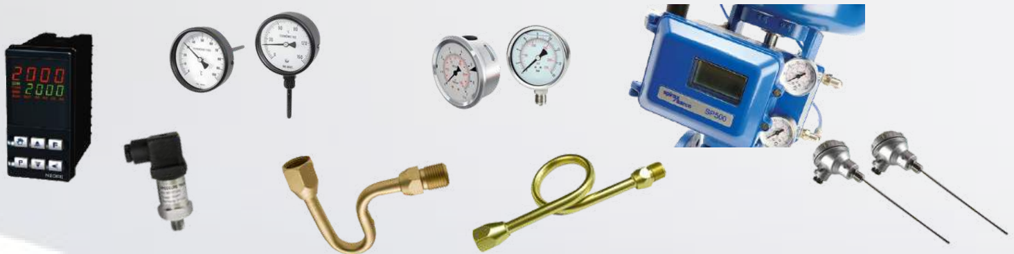
MANÔMETRO - ELETROPOSICIONADOR - PT100 TERMÔMETRO TUBO SIFÃO