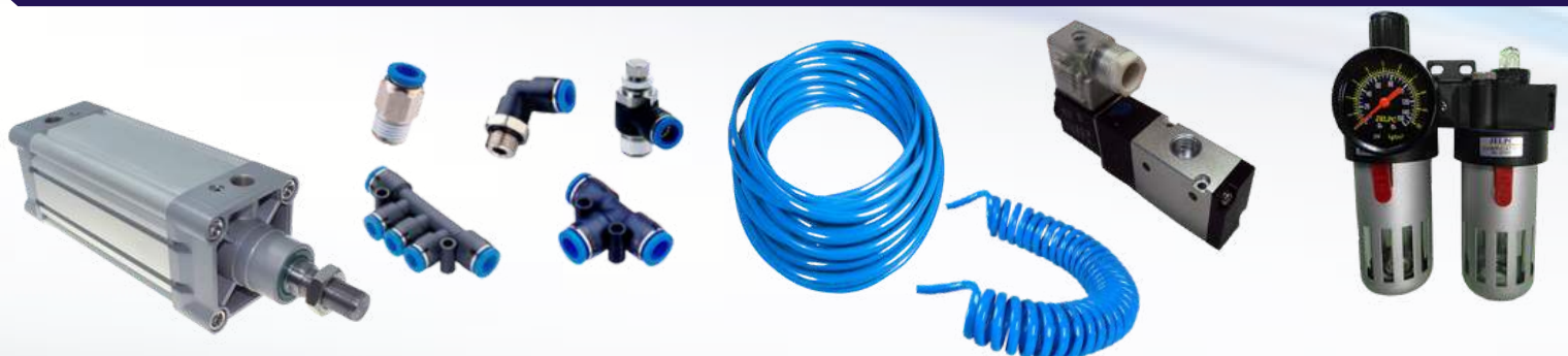
CILINDRO - CONEXÕES - MANGUEIRA - VÁLVULAS PNEUMÁTICAS - FILTRO REGULADOR