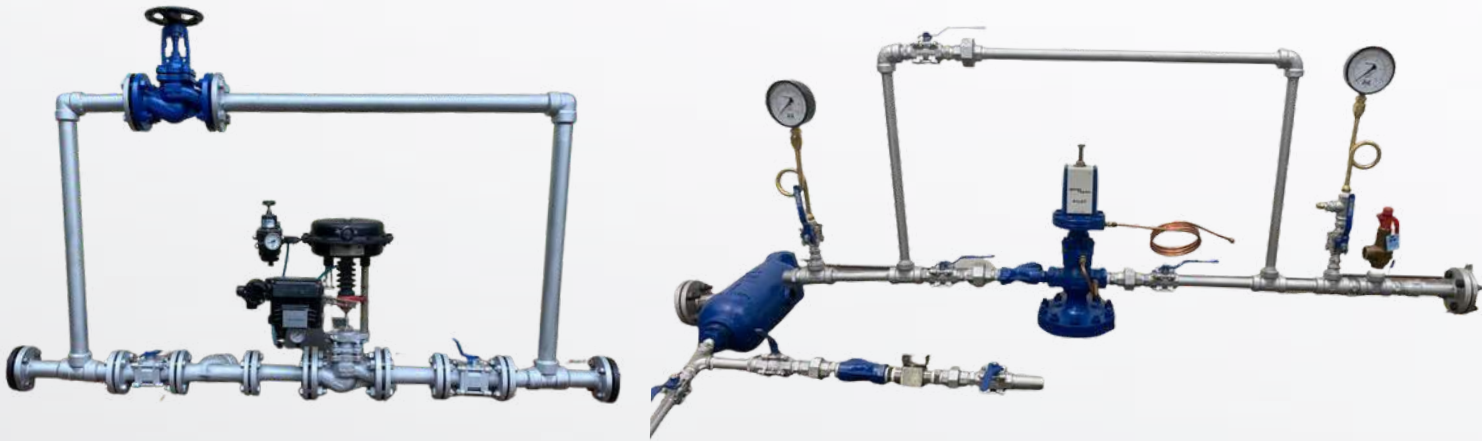
REDUTORA DE PRESSÃO - CONTROLE DE TEMPERATURA DRENAGEM COM PURGADOR