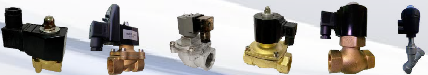
VÁLVULA SOLENOIDE - VÁLVULA FILTRO MANGA VÁLVULA PARA VAPOR VÁLVULA ANGULAR